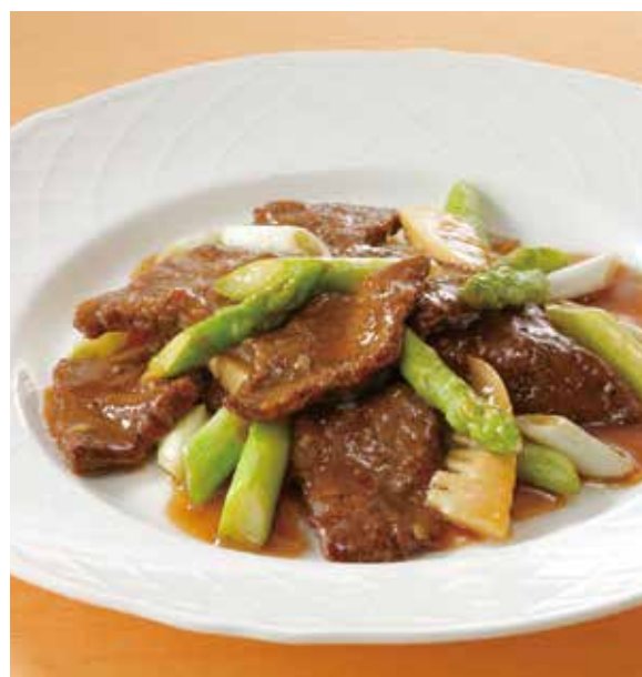
4. 蠔油龍鬚牛肉 ..... 2,860