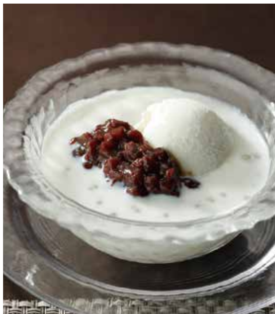
5. 西米奶露雪糕 ..... 990 Coconut milk with tapioca and ice cream (fruit or red beans) タピオカのココナッツミルク、 ココナッツアイスクリーム添え ※フルーツまたは小豆からお選びください