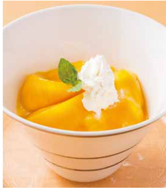
2. 香杧布丁 ..... 1,210 Mango pudding マンゴープリン マンゴーの果肉を使い、フルーティーな香りととろける食感が人気です。