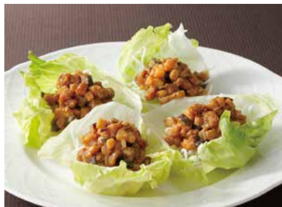
8. 生菜包肉鬆 ..... 2個 1,760 Sautéed minced pork with lettuce