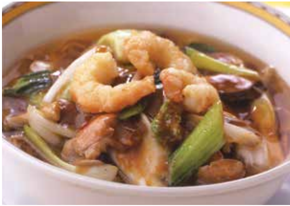
3. 亜寿多麺 ..... 2,200 Aster special soup noodles