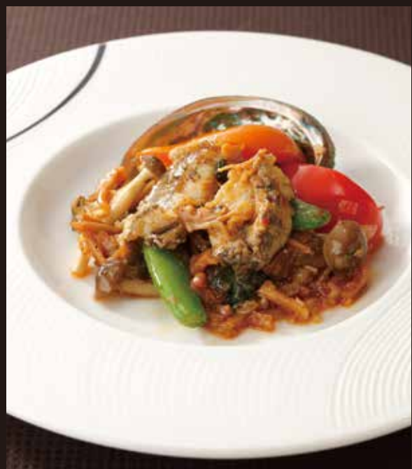
4. XO醬炒鮑魚 ----- 1~2名様用 3,520