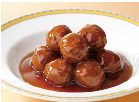
7. 糖醋丸子 ..... 2,530 Fried meat balls (Sweet sour sauce)

豚肉をたっぷりのキャベツと一緒に甘味噌で仕上げました。四川の名物料理ですがあまり辛くありません。