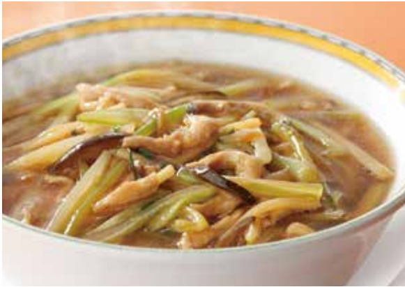
5. 芹菜湯麺 ..... 2,310 Soup noodles with celery and pork