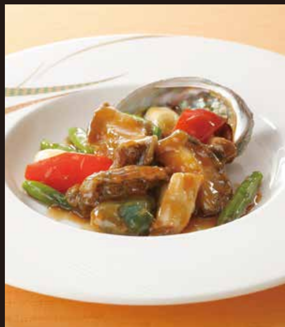
3. 蠔油炒鮑魚 ----- 1~2名様用 3,520

鮑をやわらかく蒸しあげ、葱を炒めて香りに移した油と香味野菜を使った醤油だれと共に楽しみいただきます。