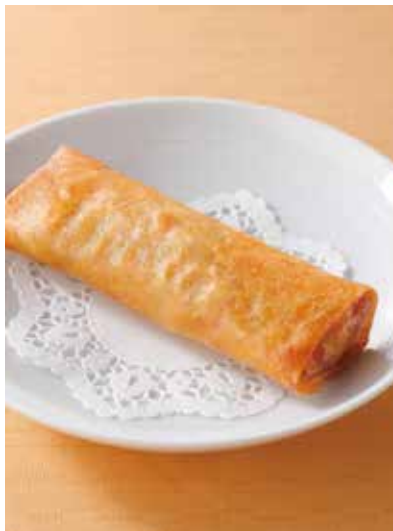
6. 炸春巻 ..... 1本 440