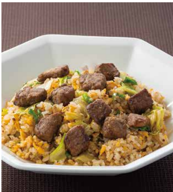
5. 牛肉生菜炒飯 ..... 2,750