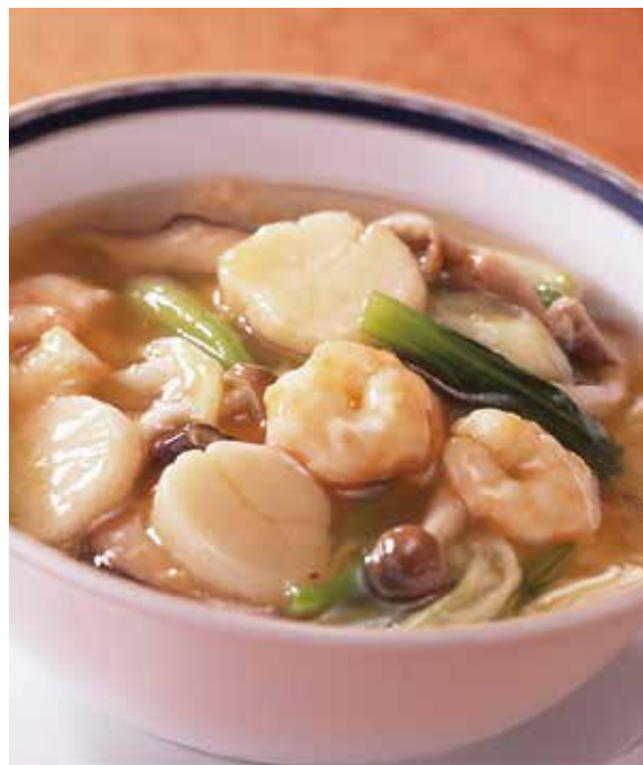
2. 蝦仁鮮貝湯麺 ..... 2,640 Soup noodles with shrimp and scallop