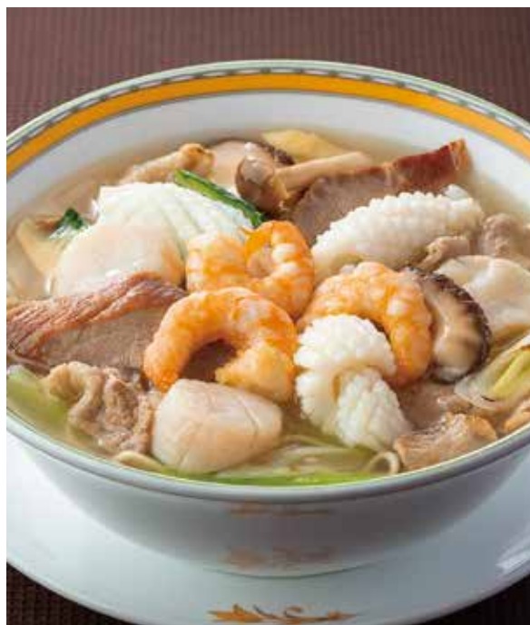
1. 什錦湯麺 ..... 2,750 Soup noodles with sautéed pork, seafood and vegetables