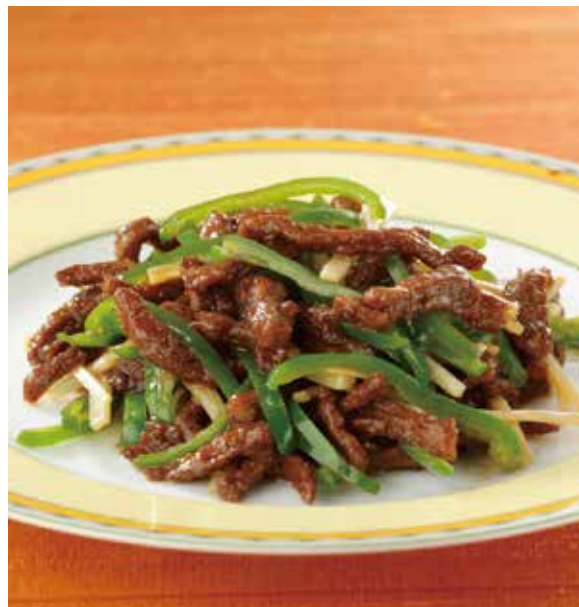
2. 青椒牛肉絲 ..... 2,860

北京の名物料理をお一人さま用にご用意しました。 お口直しのサラダと共に召し上がりください。