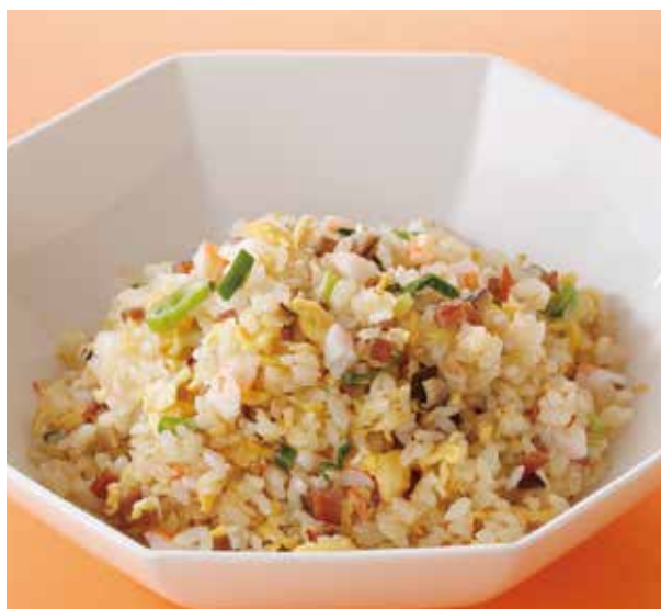
4. 什錦炒飯 ..... 2,200

野菜をたっぷり使い、海老、豚肉、チャーシューをトッピングした あんかけ焼きそばは、昭和を通じてお客様に愛された逸品です。