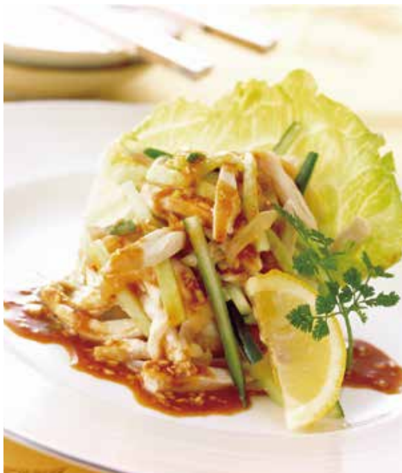
6. 棒棒鶏 ..... 1~2名様用 1,760 Cold chicken with jellyfish (Sesame sauce)

青葱と生姜のソースがスープで蒸し煮にした鶏のうまみを引き出す、広東式の前菜です。