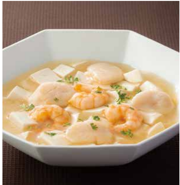
4. 双鮮豆腐 ..... 2,640 Braised tofu with scallop and shrimp

六種彩り野菜ときのこのXO醬炒め 干し貝柱とフライドガーリックのうまみと唐辛子の辛味を 生かしたXO醬で各種野菜を炒めました。