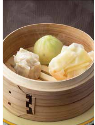
5. 三種点心 ..... 880