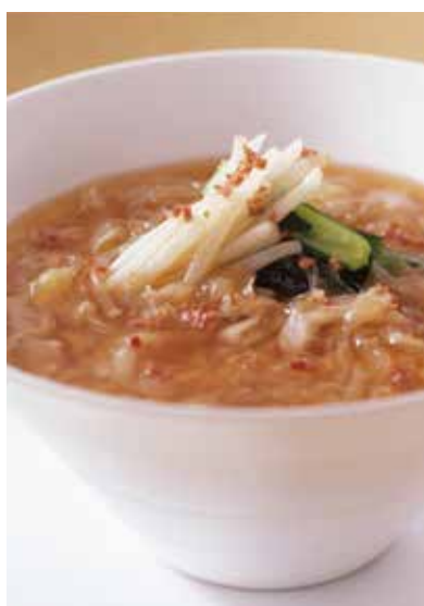
8. 魚翅泡飯 ..... 4,400

牛肉とセロリー、アスパラガス、筍など各種野菜と共に炒めました。人気のあんかけご飯です。