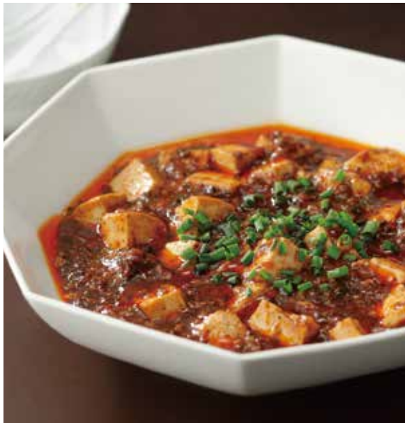
4. 陳麻婆豆腐 ..... 2,420 Spicy braised tofu and minced beef (Very hot) 陳麻婆豆腐 (辛味は調整できます) 山椒、唐辛子を使った本格的な辛さの四川成都式牛肉の麻婆豆腐です。