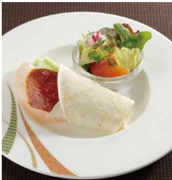
1. 北京烤鴨 ..... 1切 1,100