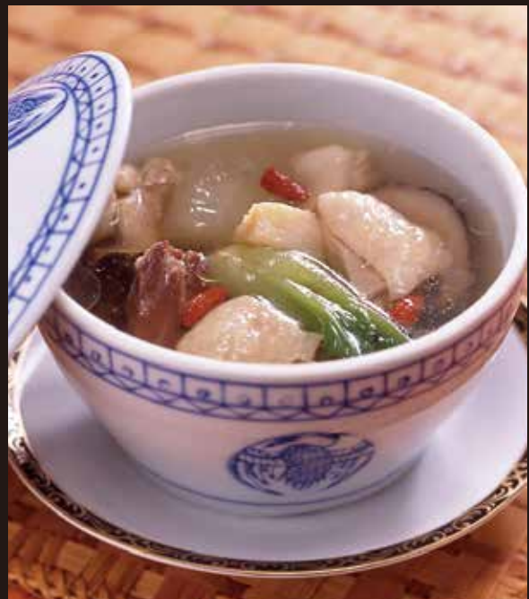
4. 遊彩燉湯 ..... 1,980 Steamed soup with chicken and beef tendon 鶏肉と牛アキレス腱と野菜の燉湯 牛アキレス腱のコラーゲンと鶏肉のうまみが渾然一体となって生まれる味わいをどうぞ堪能ください。