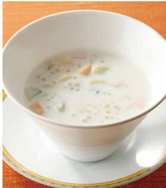
4. 西米奶露 ..... 880 Coconut milk with tapioca (fruit or red beans) タピオカのココナツミルク ※フルーツまたは小豆からお選びください