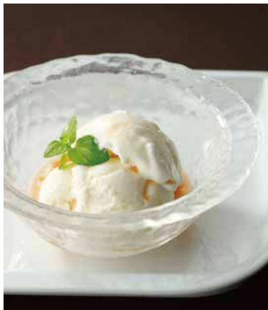
6. 雪糕 ..... 880 Ice cream アイスクリーム ※バニラまたはコラーゲン入りココナッツアイスクリームから お選びください