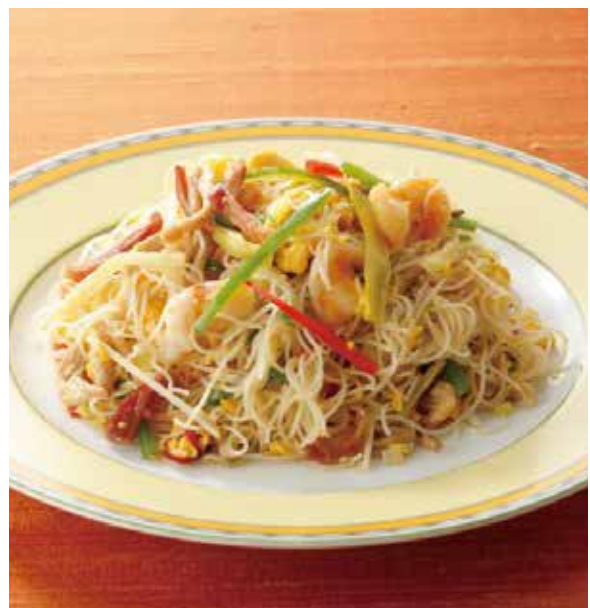
7. 福建米粉 ..... 2,200 Rice-flour noodles with pork and vegetables 福建ビーフン (スープがつきます) 豚肉、海老、野菜、卵と一緒にふっくらと炒めたビーフンは香り良く、お食事にもお酒のおともにも合います。