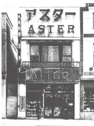
創業店舗(1926年 銀座一丁目)