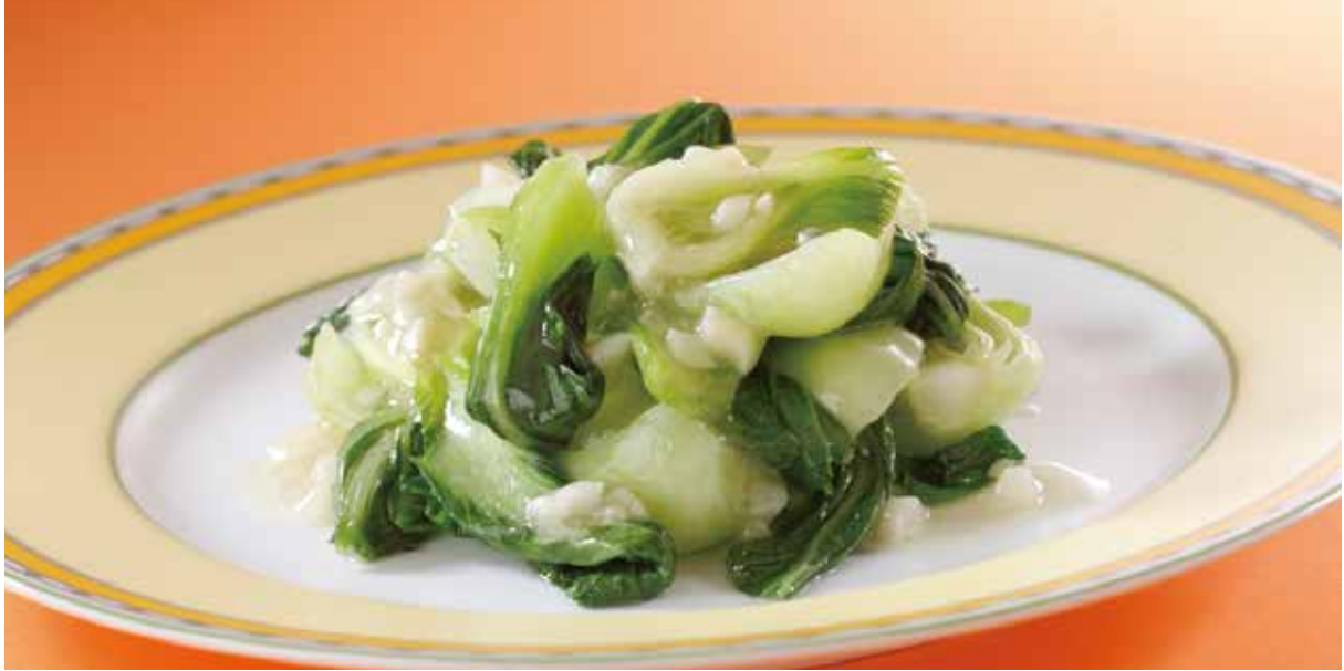
1. 橄欖油炒蔬菜 ..... 2,200 Sautéed vegetables (Extra virgin olive oil)