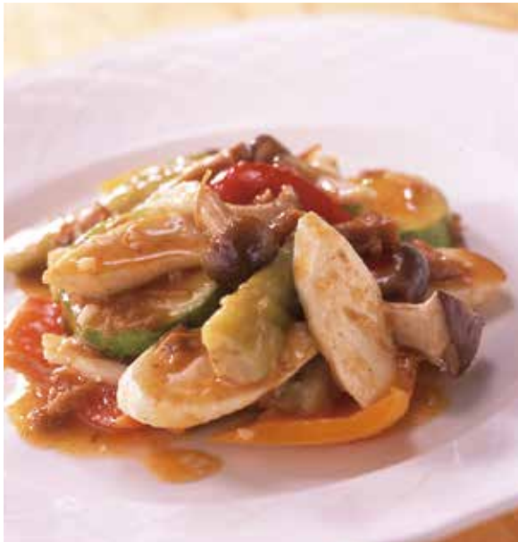
2. XO醬六蔬 ..... 2,530 Sautéed six kinds of vegetables and mushroom(XO sauce)

六種彩り野菜ときのこのXO醬炒め 干し貝柱とフライドガーリックのうまみと唐辛子の辛味を 生かしたXO醬で各種野菜を炒めました。