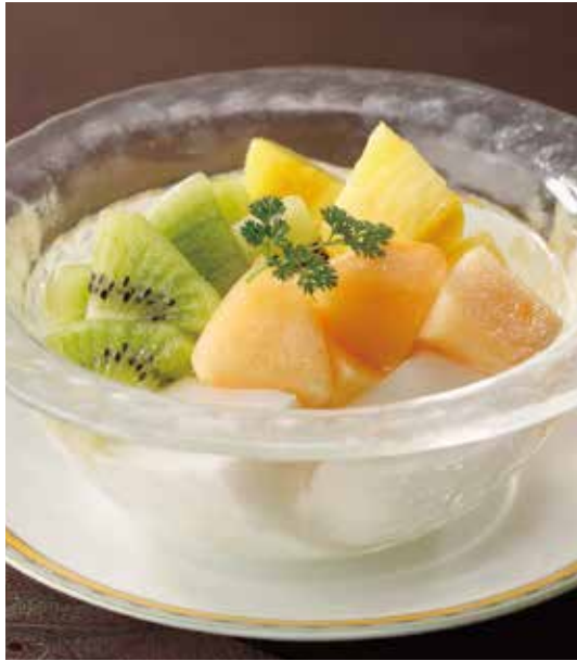
1. 鮮果杏仁豆腐 ..... 990 Almond jelly with fruit cocktail フルーツたっぷりの杏仁豆腐 香りとまろやかかさにこだわったオリジナルレシピの杏仁豆腐。フルーツは季節変わります。