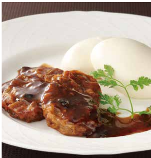
3. 豉椒牛里脊 ..... 2切 2,200