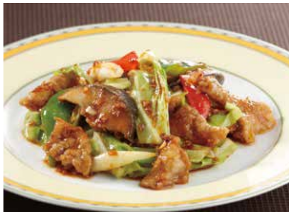
6. 回鍋肉 ..... 2,310 Sautéed pork and cabbage

オリジナルの甘酢あんの酢豚は昭和を通じてお客様にご愛顧いただく銀座アスターの名菜です。