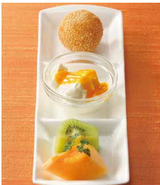
8. 甜点拼鲜果 ..... 825 Assorted dessert 一口デザートとフルーツ、 胡麻団子の盛り合わせ 中国風デザートとフルーツを少しずつ盛り合わせました。 季節により内容は変わります。