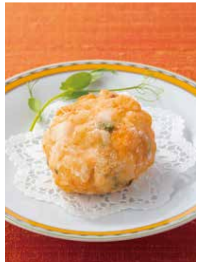
8. 百花海鮮 ..... 1個 616

カリッと香ばしく揚げた海老ワンタンをまろやかなマヨネーズクリームソースでお召し上がり下さい。