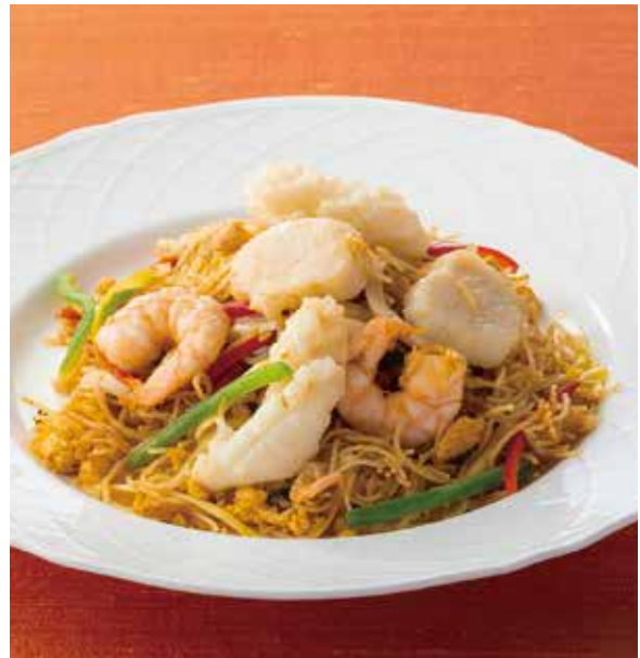
5. 海鮮星加坡米粉 ..... 2,750 Rice-flour noodles with seafood (Curry sauce) 海の幸のビーフン、カレー風味 (スープがつきます) 海の幸をたっぷり使ったご馳走ビーフン。スパイシーなカレー味です。