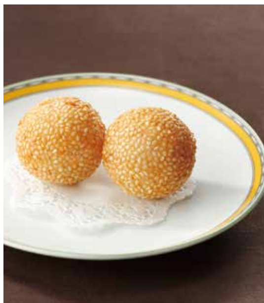
7. 炸芝麻球 ..... 2個 660 Deep fried sweet dumpling with sesame seed あん入り揚げ胡麻団子 あずきあんを包み、香ばしく揚げました。 ご追加は一個単位で承ります。