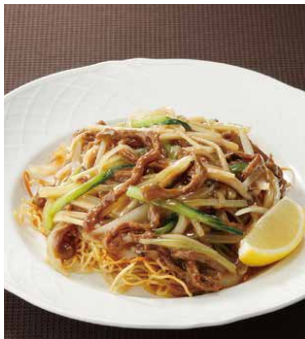
2. 広東炒麺 ..... 2,420

帆立貝、いか、海老など海の幸を贅沢に使いました。 野菜もたっぷり入ったバランスの良い焼きそばです。