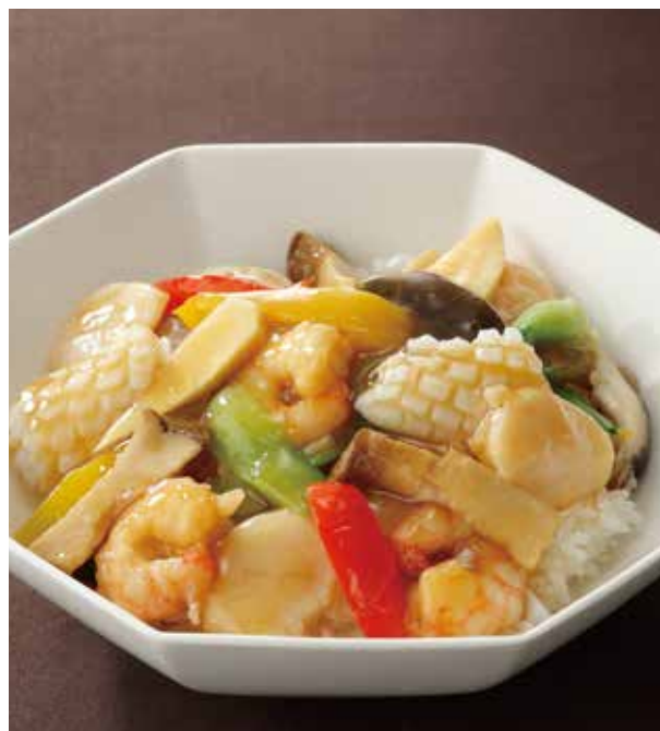
6. 海鮮燴飯 ..... 2,640

みずみずしいレタスの味わいをそのままに、強火で仕上げた炒飯に牛フィレ肉の炒め物をトッピングしたボリュームたっぷりの一皿です。