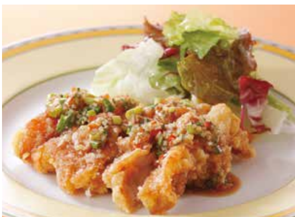
9. 油淋鶏 ..... 2,420 Fried chicken (Salty sweet sauce)

味噌風味で仕上げたレタス包みは、昭和を通じてお客様にご愛顧いただく名物料理です。