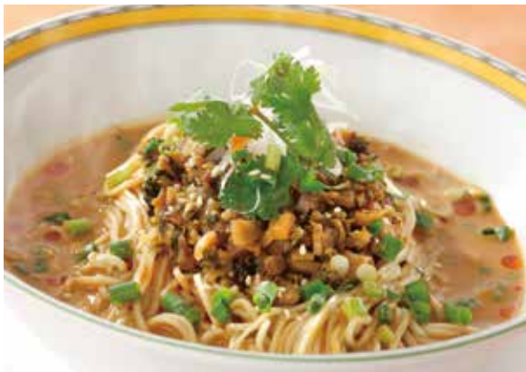
7. 担担麺 ..... 1,980 Noodles with minced beef (Hot)

ラー油と酢の絶妙なバランスがうま味になる刺激的なスープ。くせになるおいしさです。