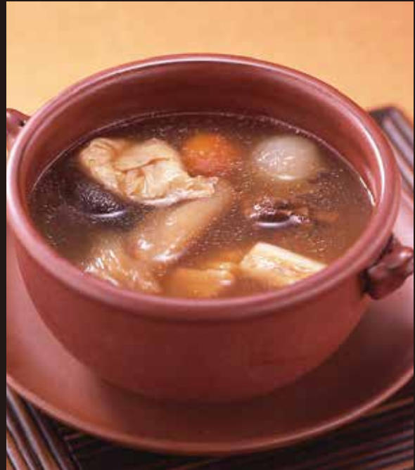
2. 牛筋満壇香 ..... 2,090 Steamed soup with beef tendon 牛アキレス腱と野菜の満壇香 野菜と牛アキレス腱がとろりと溶け込んだ滋味豊かなスープをどうぞ召し上がれ。