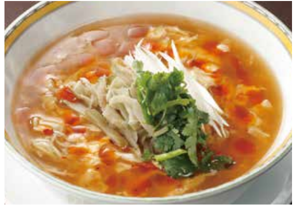
6. 酸辣湯麺 ..... 2,090 Hot and sour soup noodles

豚肉、セロリー、筍、椎茸を炒め、醤油味のスープで仕上げました。昭和30年代からお客様にご愛顧いただいている逸品です。