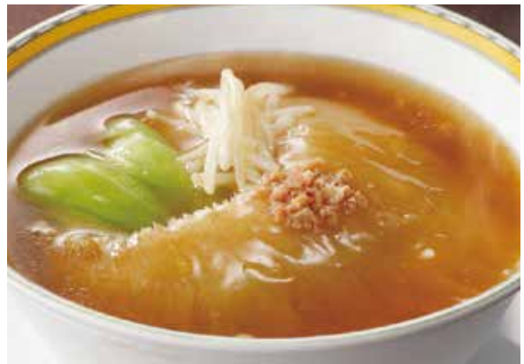
8. 排翅麺 ..... 19,800/ ハーフ 9,900 Soup noodles with braised whole shark's fin

牛肉、高菜、ザーサイを炒めた具とラー油を加えたオリジナルの練り胡麻たっぷりスープがベストマッチの一品です。