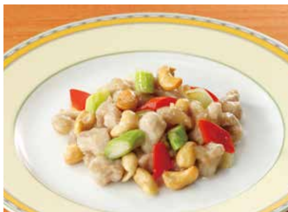
10. 腰果炒鶏丁 ..... 2,420 Sautéed chicken and cashew nuts

カラリと揚げた鶏のもも肉を豪快に切り分けて、四川風の香味ソースを回しがけました。アツアツをどうぞ。