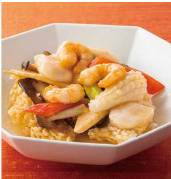
6. 海鮮鍋粿 ..... 2,750 Sautéed seafood served on crisp rice 海の幸のおこげ料理 海の幸のあんを香ばしく揚げたおこげにかけた時の「ジュー」という音も楽しい、人気の一品です。