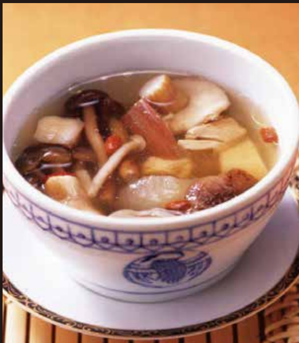
3. 蘑菇燉湯 ..... 2,310 Steamed soup with chicken, porcini, and five kinds of mushroom ポルチーニと五種きのこ鶏肉の燉湯 器ごと蒸すことで、ポルチーニの香りと季節のきのこのうまみが鶏のスープに溶け込みます。お熱いうちにお楽しみください。