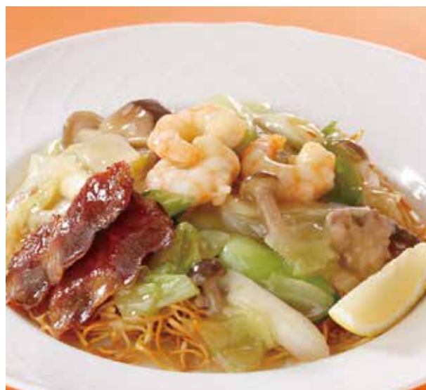
3. 什錦炒麺 ..... 2,200