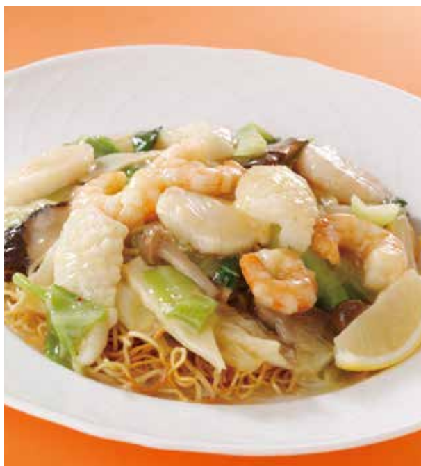
1. 海鮮炒麺 ..... 2,750