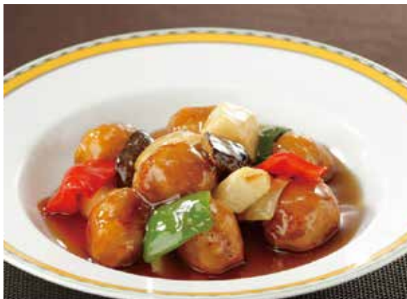
5. 糖醋里脊 ..... 2,530 Sweet sour pork