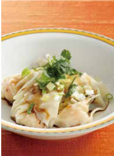
4. 蒸蝦仁雲呑 ..... 4個 880