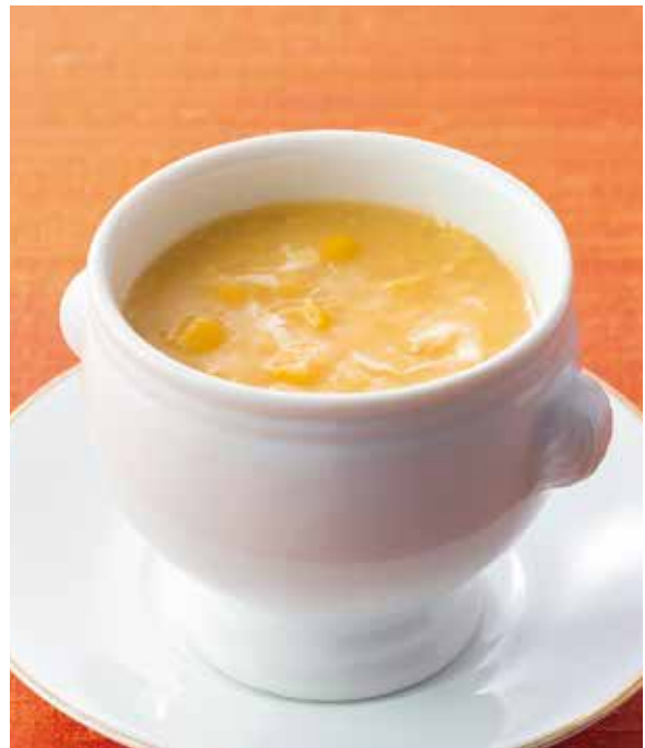
7. 包米湯 ..... 2~3名様用 2,420 Corn soup 1名様用 1,100

香りのよい芝麻醬(胡麻ソース)がくらげと蒸し鶏にベストマッチ。時代を越えて親しまれているロングセラー商品です。