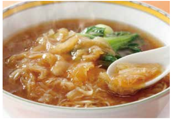
4. 魚翅麺 ..... 6,050/ ハーフ 3,300 Soup noodles with braised shark's fin

アスター麺は昭和33年生まれ。麺は卵を練りこんだ細麺。秘伝の味噌を使った濃厚でまろやかな味わいが人気です。