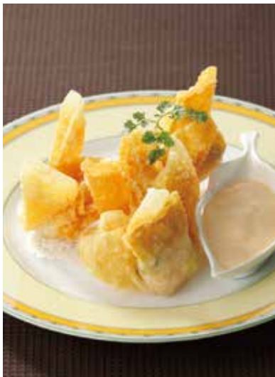
7. 炸蝦仁雲呑 ..... 4個 880

豚肉、筍、椎茸など、しっとりと炒めた具を巻き、カリッと揚げました。塩山椒をつけてどうぞ。