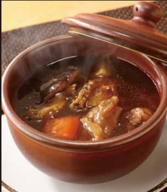
1. 遊彩満壇香 ..... 3,080 Steamed soup with abalone and beef tendon 鮑と牛アキレス腱と野菜の満壇香 蓋をとると湯気とともにあふれ出る香り。コラーゲンを含む牛アキレス腱を鮑とともにじっくりと蒸しあげました。