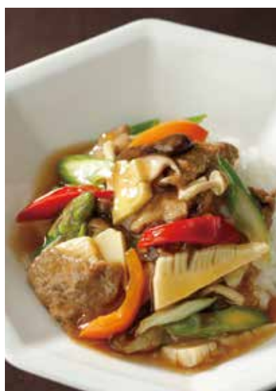
7. 牛肉燴飯 ..... 2,420

Beef and vegetables sauté served on rice