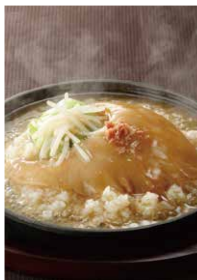
9. 紅焼排翅飯 ..... 19,800

吉切鮫等を煮込んだ本格的なふかのひれのスープをそのままかけた味わい深いご飯です。