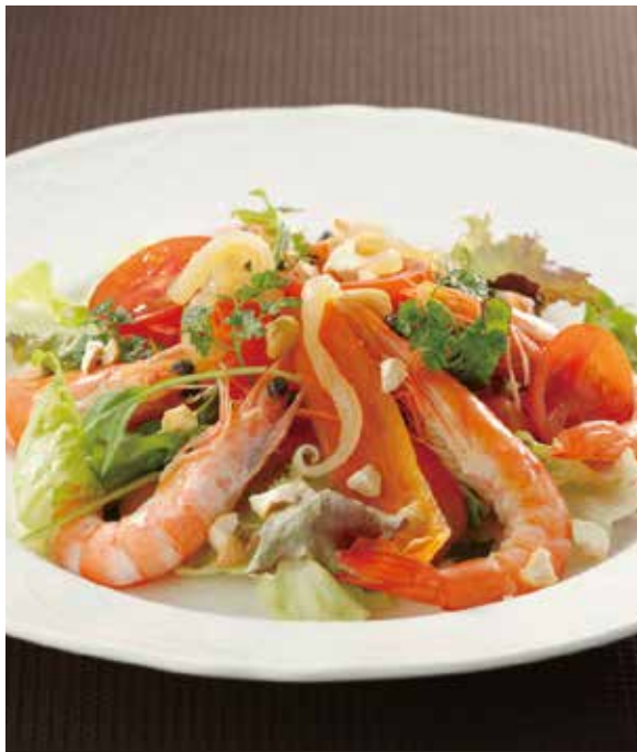
4. 沙律蝦 ..... 1~2名様用 2,310 Prawn and nuts salad