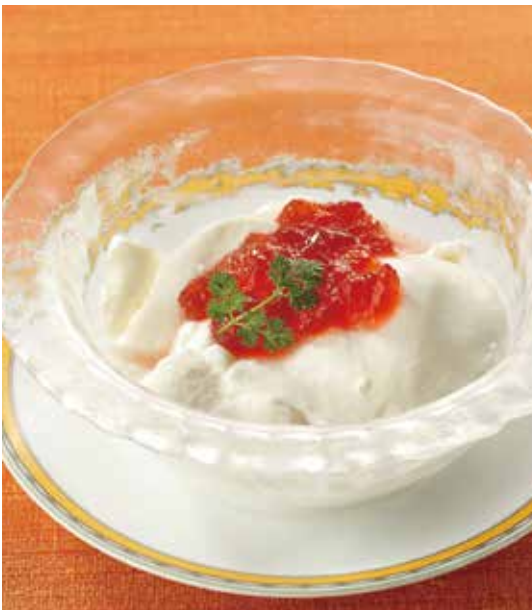
3. 鮮奶豆腐 ..... 880 Soft almond jelly コラーゲン入りやわらか杏仁 コラーゲンの入ったなめらかな舌触りの杏仁豆腐。フルーツジュレは季節変わります。