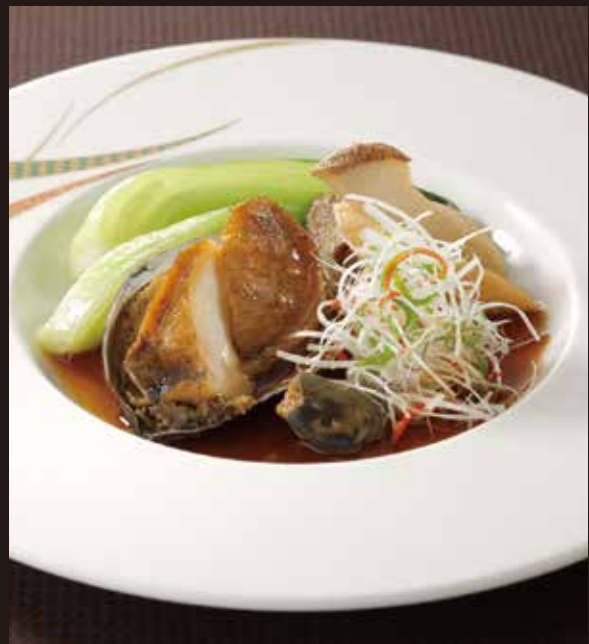
2. 葱油原殻鮑魚 ----- 1~2名様用 3,520

中国の粒味噌(ドウチー)を炒めて作る香りの良いソースが鮑のうまみを引き出します。