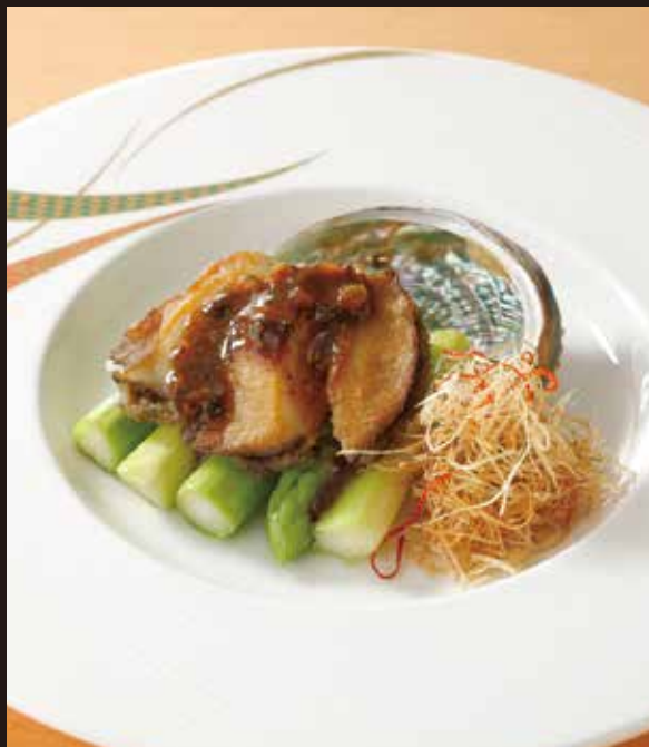
1. 豉汁煎鮑魚 ----- 1~2名様用 3,520

Sautéed abalone with fermented soy beans sauce