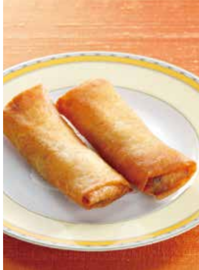
4. 炸春巻 ----- 1本 400 Spring rolls (税込 440)

海老のすり身に帆立貝、いかと野菜を加えふんわりと揚げました。 海の幸のうまみあふれる点心です。