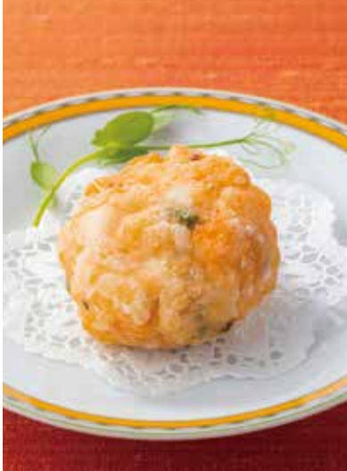
3. 百花海鮮 ----- 1個 560 Deepfried shrimp paste (税込 616) and minced seafood ball