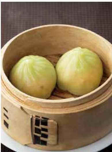
7. 翡翠水晶包 ----- 2個 700 Steamed shrimp dumpling (税込 770)