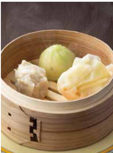
6. 三種点心 ----- 800 Three kinds of dimsum (税込 880)

カリッと香ばしく揚げた海老ワンタンをまろやかなマヨネーズクリームソースでお召し上がり下さい。