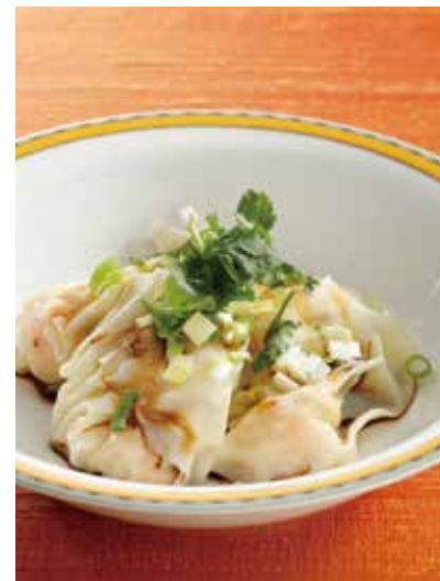
8. 蒸蝦仁雲吞 ----- 4個 800 Steamed shrimp wonton (税込 880)