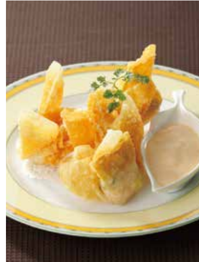
5. 炸蝦仁雲吞 ----- 4個 800 Fried shrimp wonton (税込 880) (mayonnase sauce)

豚肉、筍、椎茸など、しっとりと炒めた具を巻き、カリッと揚げました。 塩山椒をつけてどうぞ。