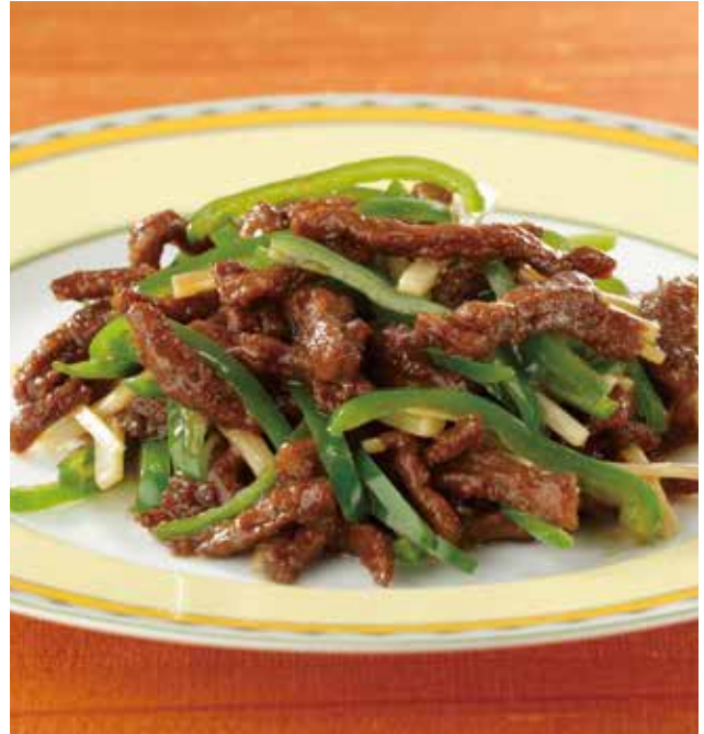
2. 青椒牛肉絲 Sautéed beef and pimiento ..... 2,600 牛肉とピーマンの (税込 2,860) 細切り炒め