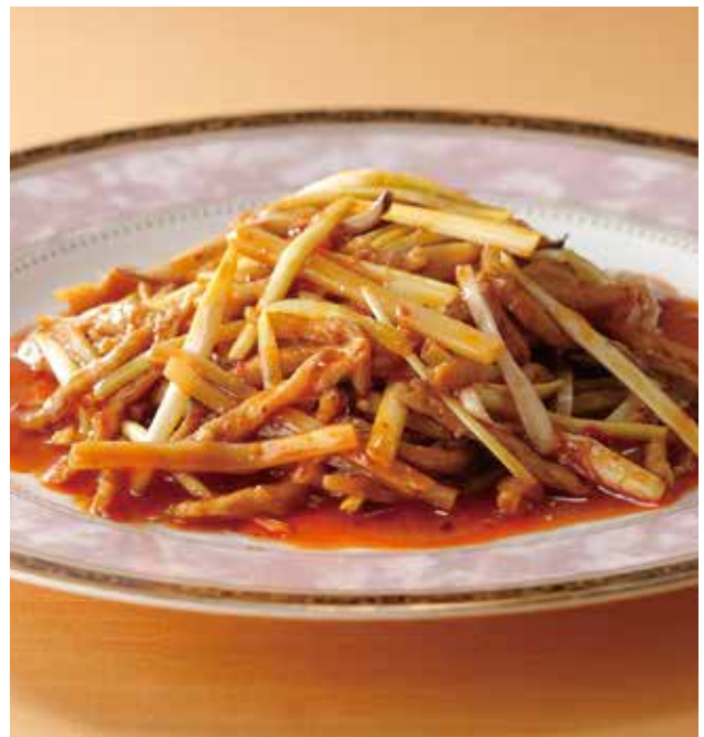
4. 魚香肉絲 Sautéed pork (Sweet and hot-sauce) ..... 2,200 四川名菜、 (税込 2,420) 豚肉の甘辛炒め