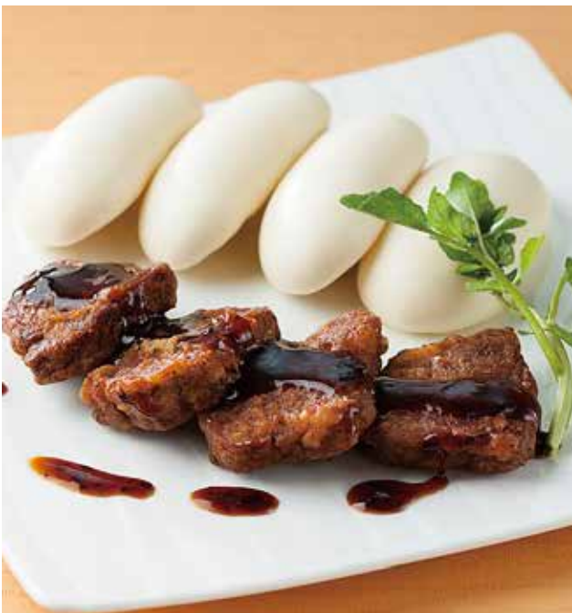
3. 豉椒牛里脊 Sautéed beef with fermented soy beans 4切 3,000 牛フィレ肉のステーキ、 (税込 3,300) マントウ添え