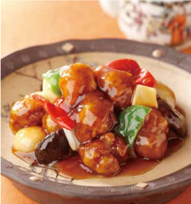
1. 糖醋里脊 Sweet sour pork ..... 2,200 酢豚 (税込 2,420)